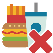
吃东西/喝水/嚼口香糖