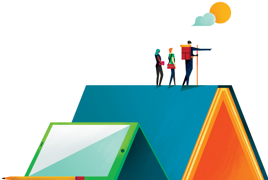
图例制作人: Dan Matutina