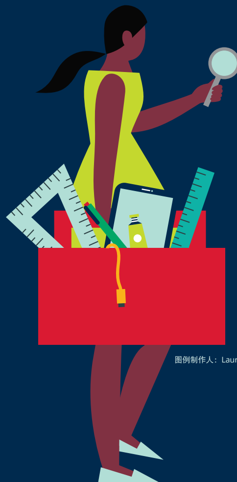
图例制作人: Lauren Rolwing