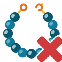
厚度超过1/4英寸 (1/2厘米) 的首饰