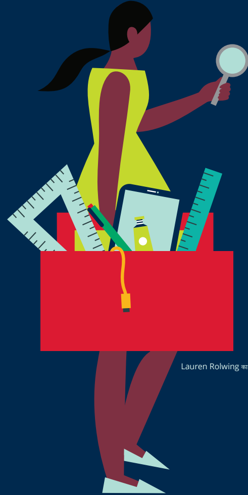
Lauren Rolwing का उदाहरण